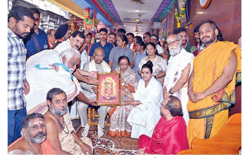
మాజీ రాష్ట్రపతి రామ్ నాథ్ కోవింద్ కు దుర్మరణం అందచేస్తున్న అలయం జె.కె.ఎస్ రామ్ నారాపు