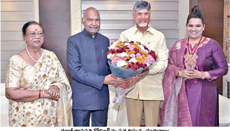
మాజీ రాష్ట్రపతి కోవింద్ ను సత్కరిస్తున్న చంద్రబాబు