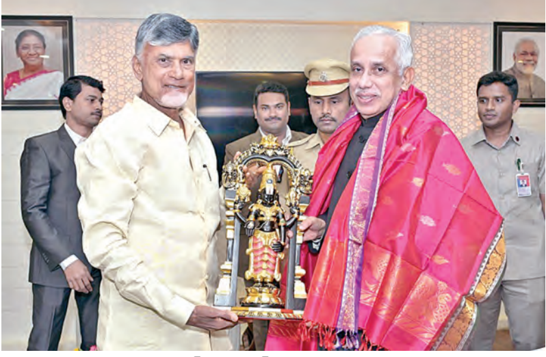
శుక్రవారం గవర్నర్ అబ్దుల్ నజీర్ సంతకపుస్తకం సేవం చంద్రబాబు